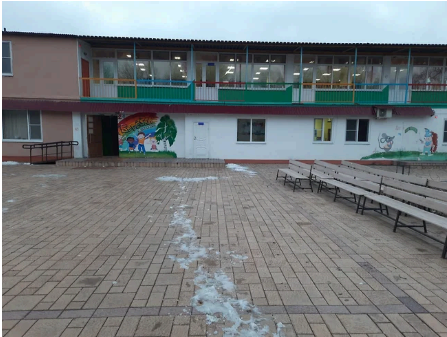
ГБУ АО «ЦОД „Березка“»

Прокуратура Астраханской области через суд взыскала 13 млн руб. убытков с подрядчика из Грозного по причине срыва госзаказа. Контракт стоимостью 47 млн руб. на строительство модульного корпуса детского лагеря «Березка» в селе Яксатово был заключен в марте 2024 года с ООО «Группа Астар». Недобросовестными действиями суд признал поставку строительных панелей, не соответствующих условиям договора. Подрядчик в параллельном судебном процессе пытается обжаловать решение УФАС о включении его в реестр недобросовестных поставщиков.